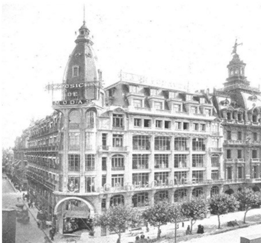
Imagen 1. Gath & Chaves.