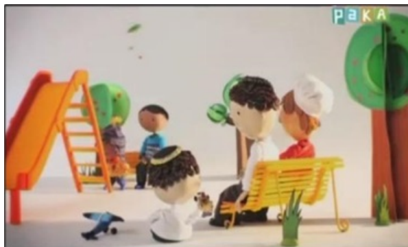
FIGURA 3 Frases en cajitas. Episodio que habla sobre la convivencia cultural

En otro episodio, vemos a dos niñas divirtiéndose en la plaza; ambas juegan en las hamacas, se tiran por los toboganes y se impulsan en el clásico “sube y baja”. La música instrumental acompaña el vínculo afectivo que las chicas cimientan durante unos pocos minutos, hasta que, finalmente, una de ellas se retira porque lxs padres/madres deben irse del lugar. Así, el plano retrata a una familia cartonera que lleva un carrito de supermercado cargado de objetos de la calle y que se encuentra vestida con ropa remendada (Figura 4). Efectivamente, la sutileza permite darle lugar al tratamiento de temas tabúes, como pueden ser la discriminación, la xenofobia o la intolerancia étnica para estimular actitudes morales en lxs niñxs con respecto a la integración social. En este sentido, el enunciador maestro opera generando una conciencia ciudadana basada en el altruismo, la empatía y el compromiso con los sectores más vulnerables.