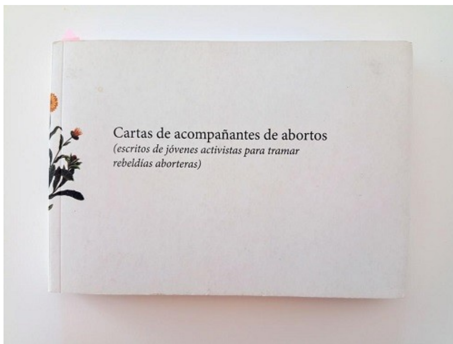
Figura 1: Portada del libro

Fuente: Cartas de acompañantes de abortos ( escritos de jóvenes activistas para tramar rebeldías aborteras ), 2021. Diseño: María Reboredo.