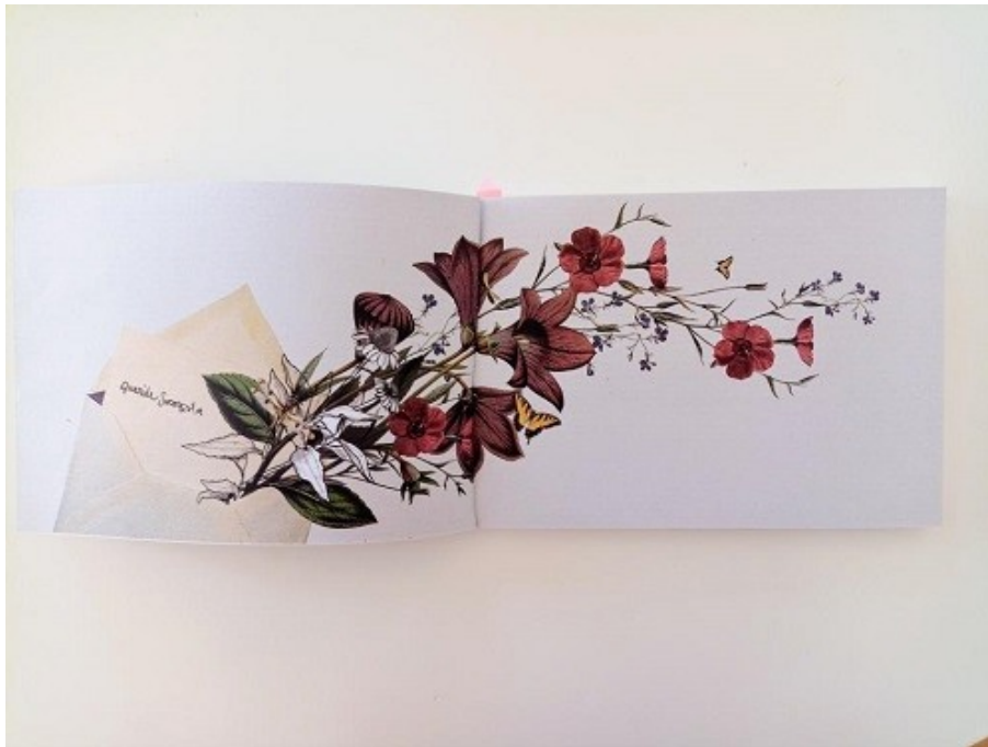
Figura 2: Ilustración a doble página del libro

Fuente: Cartas de acompañantes de abortos ( escritos de jóvenes activistas para tramar rebeldías aborteras ), 2021. Diseño: María Reboredo.