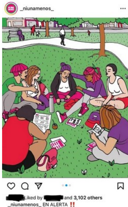
Figura 2: Posteo de Ni Una Menos en respuesta a la detención de las activistas en Villa María