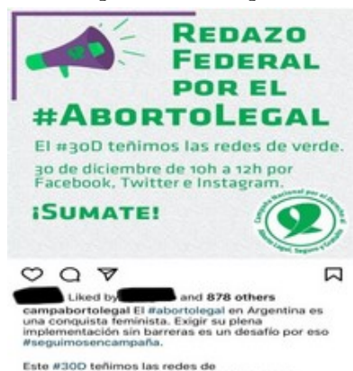
Figura 3. Redazo Federal promovido por la Campaña Nacional por el Derecho al Aborto Legal, Seguro y Gratuito