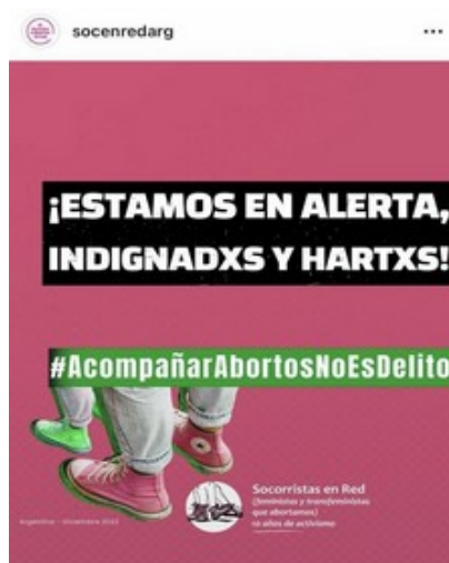
Figura 1: Publicación de Socorristas en Red ante la detención de las activistas de Villa María