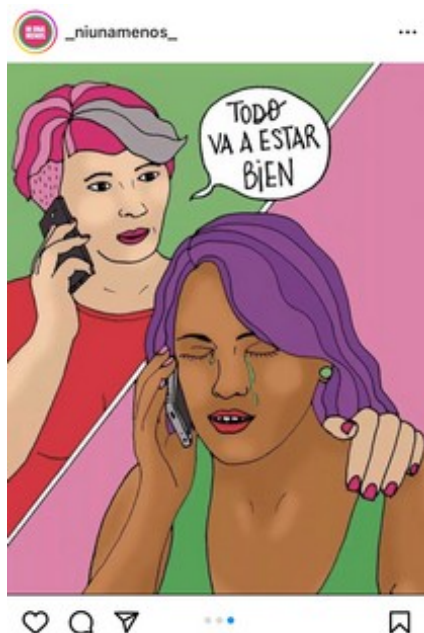
Figura 5. Posteo de Ni Una Menos en respuesta a la detención de las activistas de Villa María