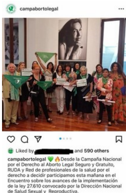
Figura 4: Campaña Nacional por el Derecho al Aborto Legal, Seguro y Gratuito en evento organizado por la Dirección Nacional de Salud Sexual y Reproductiva

Fuente: Campaña Nacional por el Derecho al Aborto Legal, Seguro y Gratuito [@campabortolegal]. (29 diciembre 2022).